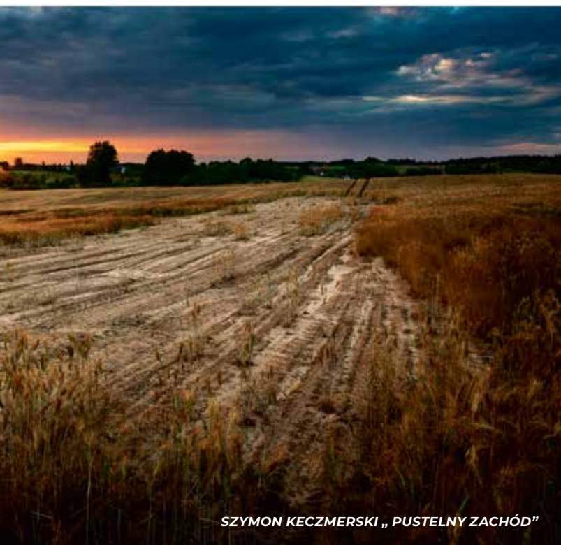
SZYMON KECZMERSKI „PUSTELNY ZACHÓD”