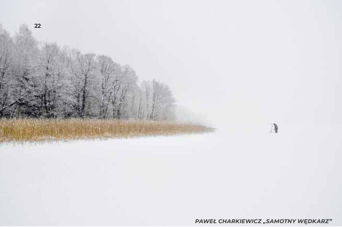
PAWEŁ CHARKIEWICZ „SAMOTNY WĘDKARZ”