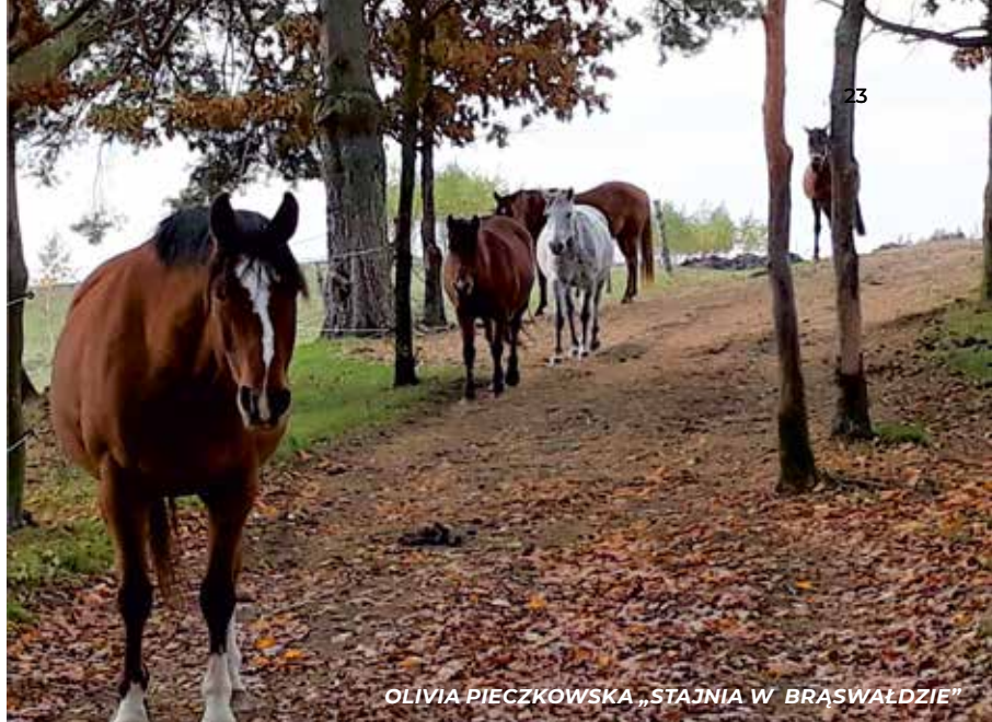
OLIVIA PIECHKOWSKA „STAJNIA W BRASWAŁDZIE”