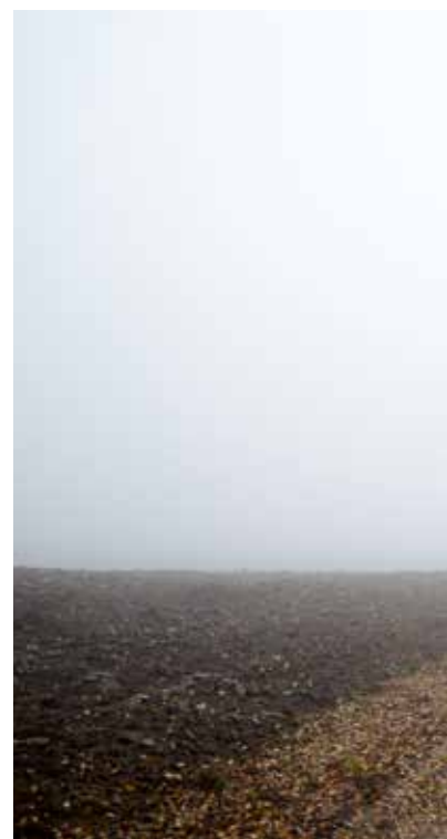
MIROSLAW TUREK „JESIEŃ”