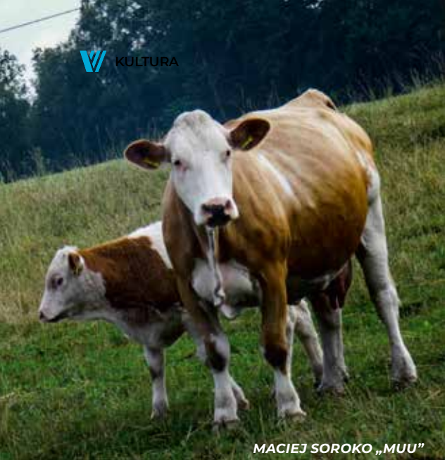
MACIEJ SOROKO „MUU”