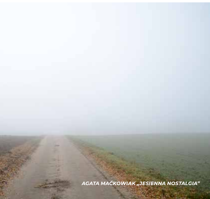
AGATA MAĆKOWIAK „JESIENNA NOSTALGIA”

ZDJĘCIA LAUREATÓW I E- DYCJI KONKURSU FOTO- GRAFICZNEGO „FOKUS NA DYWITY 2019”.