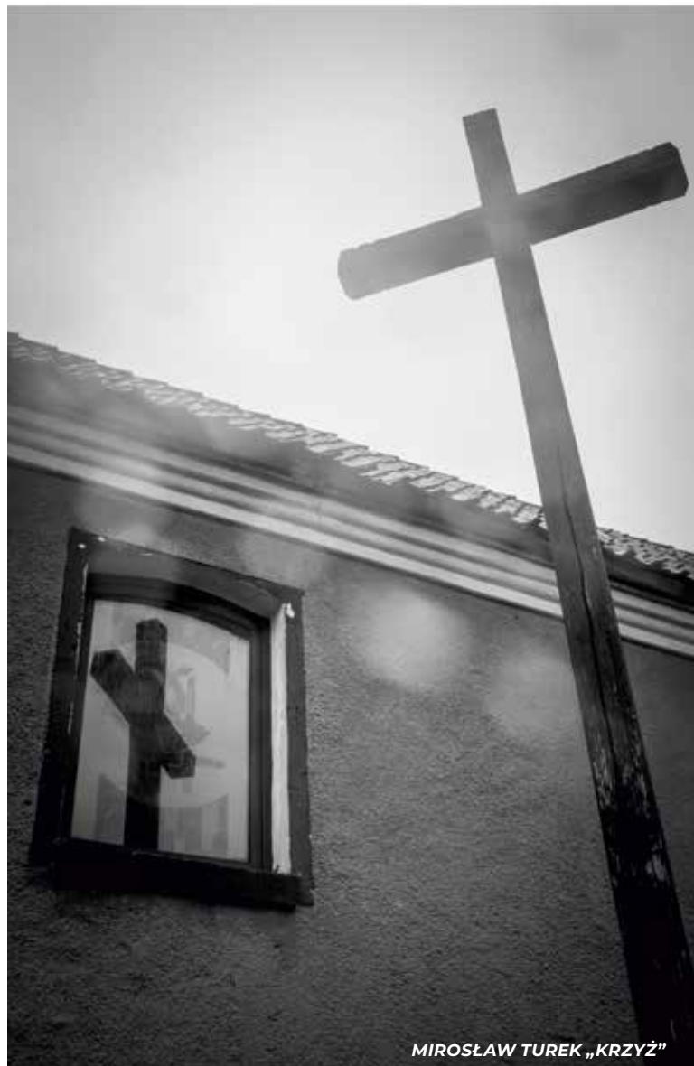
MIROSLAW TUREK „KRZYŻ”